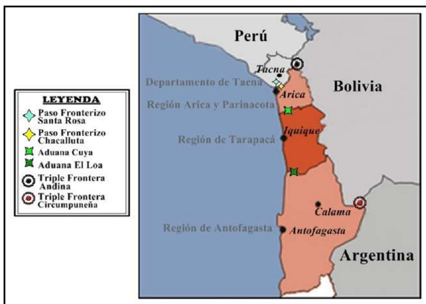
Mapa 1. Norte Grande chileno en 2014. Divisiones y capitales regionales, ciudades importantes y pasos fronterizos. Elaboración: Humberto Choque Rodríguez.

saber (de norte a sur): la Región de Arica y Parinacota (XV Región chilena), cuya capital es la ciudad de Arica; la Región de Tarapacá (I Región), capital en Iquique; la Región de Antofagasta (II Región), cuya capital es Antofagasta. Como ilustra el Mapa 1, el territorio del Norte Grande configura unas extensiones de frontera con Perú, Bolivia y Argentina no menores, lo que en gran medida determina el carácter transfronterizo que las tres regiones chilenas que lo componen han desarrollado desde el establecimiento de los actuales límites nacionales en esta área, entre fines del siglo XIX e inicios del siglo XX.