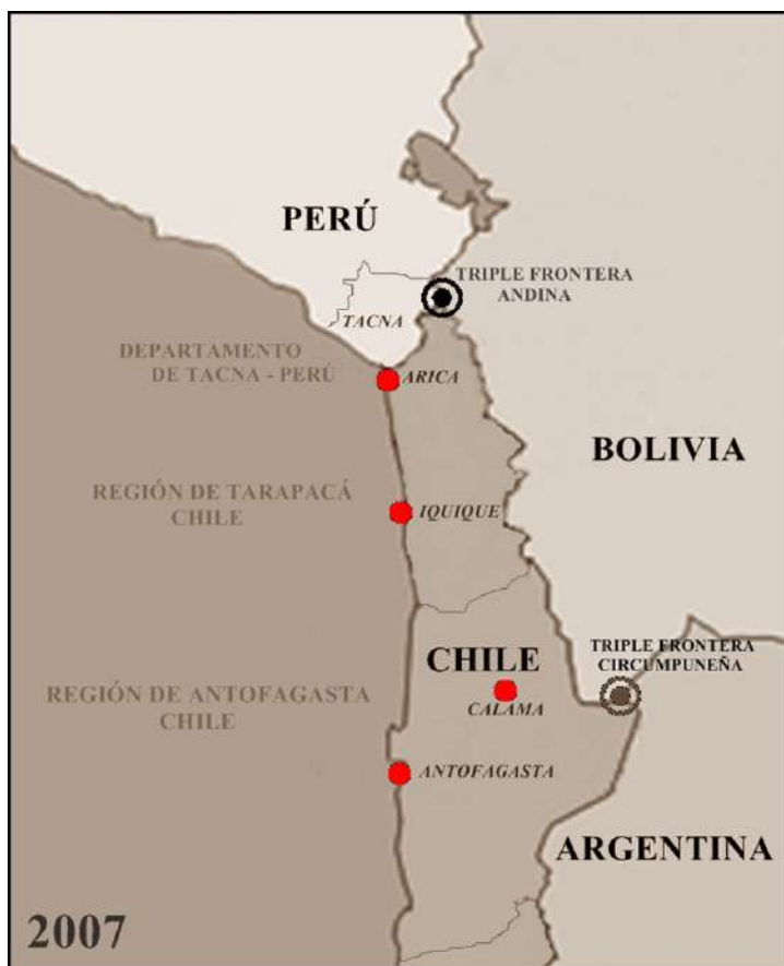
Mapa 2. Configuración territorial de la Región chilena de Tarapacá antes de la creación de la Región de Arica y Parinacota (2007). Elaboración: Humberto Choque Rodríguez.

territorio, provocado entre otras cosas por el éxodo rural desde las tierras altiplánicas hacia las ciudades de la costa en el Norte de Chile: proceso que se masifica desde los años 1960 en adelante debido a las políticas estatales “desarrollistas” o de “modernización” (Bähr, 1980; Gunderman y González, 2008; Gunderman y Vergara, 2009; Quiróz et al., 2011).