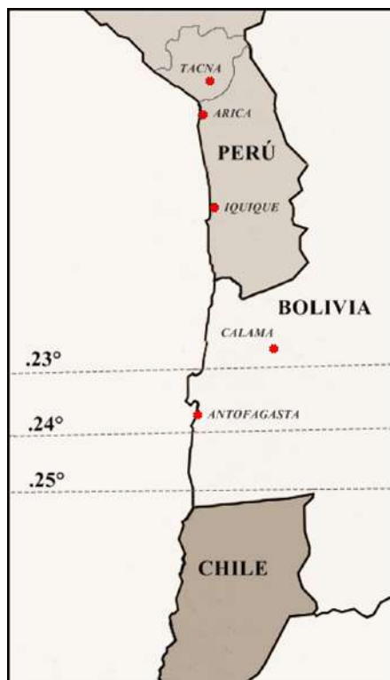
Mapa 4. Configuración territorial del Norte Grande chileno antes de la Guerra del Pacífico (1879). Elaboración: Humberto Choque Rodríguez.

Arica no siempre ha sido chilena y de hecho cuenta con solo ochenta y cinco años de serlo. La ciudad formaba parte de la República del Perú (Mapa 4), y solamente a fines del siglo XIX quedó en poder de Chile (Díaz et al., 2012, p. 160).