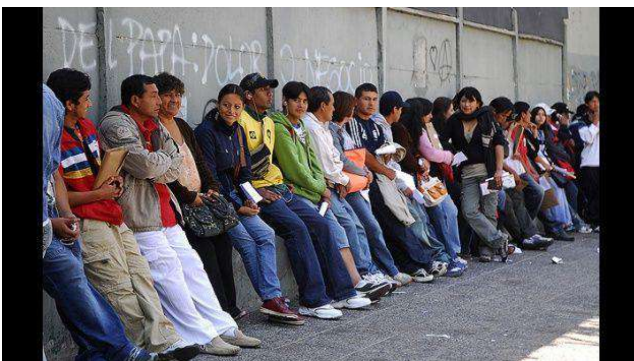
Los migrantes en Chile tienen plazo para regularizar su situación

Desde del 23 de abril, los extranjeros que hayan ingresado hasta el 8 de abril tienen tres meses para regularizar sus documentos